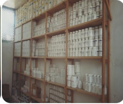
Afmadown neuvola – helmikuu 2017