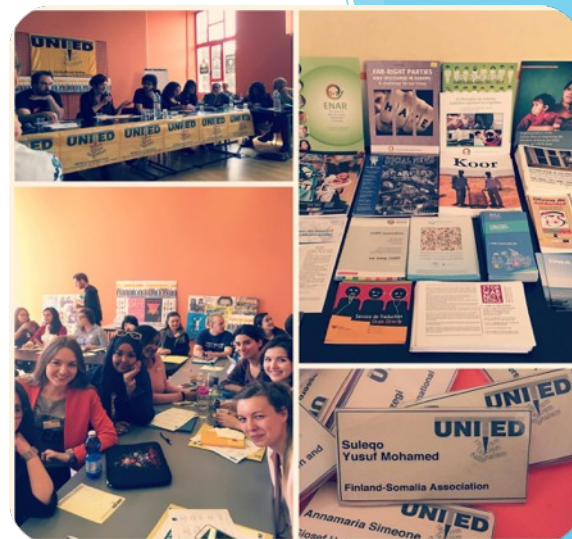
UNITED for Intercultural Action –konferenssi 2016

Seuran visio: Suomi-Somalia Seura ry on vahva ja näkyvä toimija Suomen ja Somalian välisten suhteiden kehittäjänä ja vaikuttajana, sekä saa tunnustusta toiminnastaan uranuurtajana. Seura toimii sillanrakentajana kehitysyhteistyön, kaupan, sekä kokoutumisen ja kulttuurin saralla.